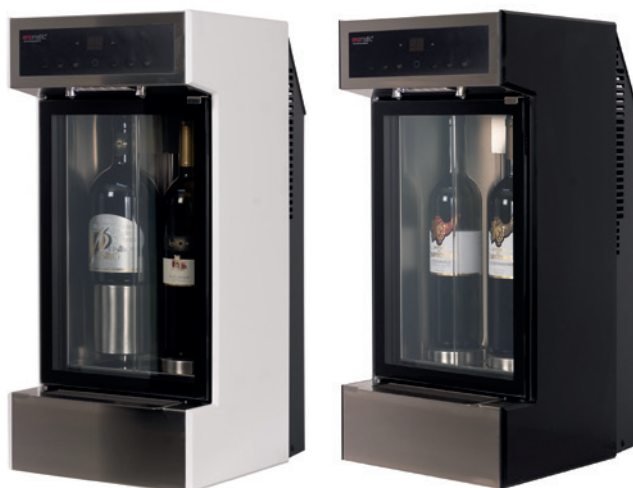
eno one 2 weiß