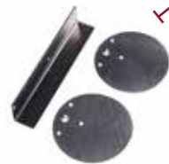
KIT À POSER