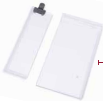
KIT CONFIGURATION 2+2