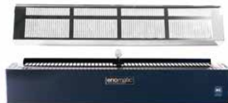
KIT TIROIR INFÉRIEUR BICOLORE